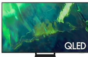
LED Bildschirm, Samsung 4K Q LED TV 65"

Wir setzen diese Geräte oft an Messen oder Liveübertragungen, wie z.B. WM oder EM ein. Satte Farben, fließende Bewegungen und ein toller Kontrast sind bei diesem 4K tauglichen Flatscreen in beispiellosem Fernsehgenuss vereint.